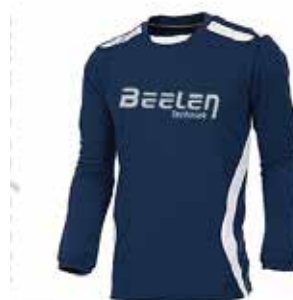
De "huisstijl" die op dit moment gehanteerd wordt in de jeugdafdeling van EGS