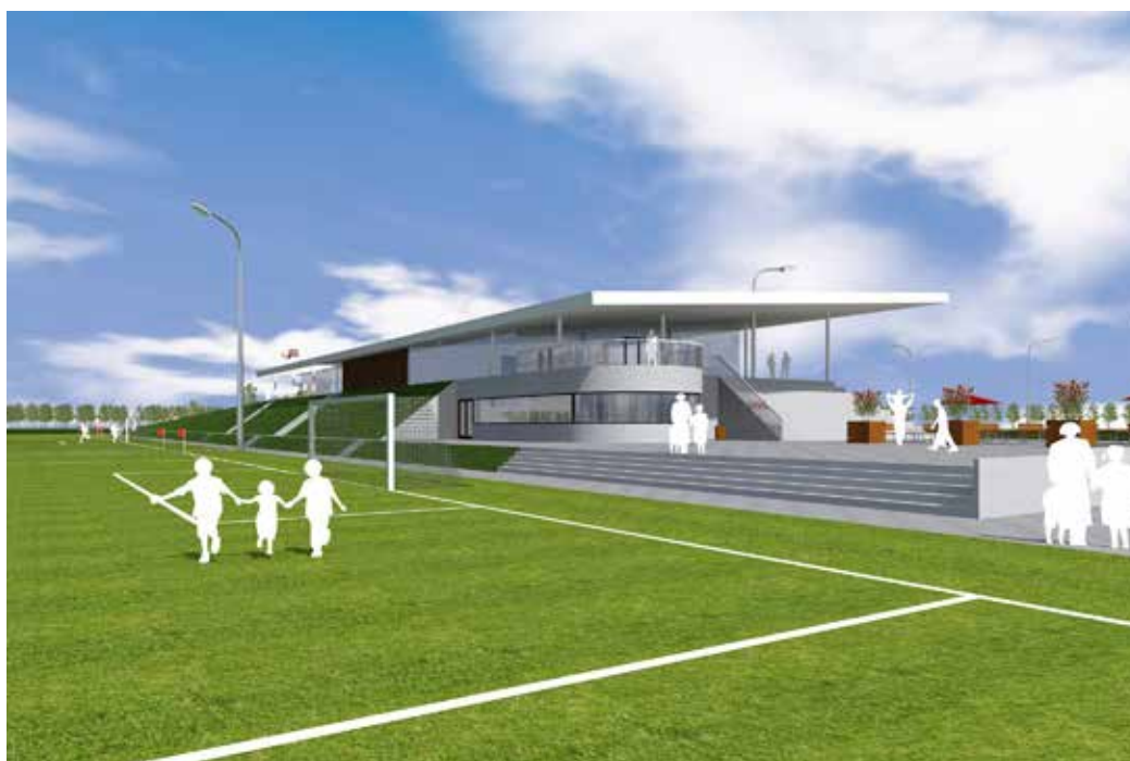
Voorlopige impressie nieuwe sportaccommodatie

Voorafgaand aan deze besluitvormende ledenvergadering zullen de leden van de drie verenigingen in aparte bijeenkomsten heldere informatie krijgen over dit fusievoorstel.